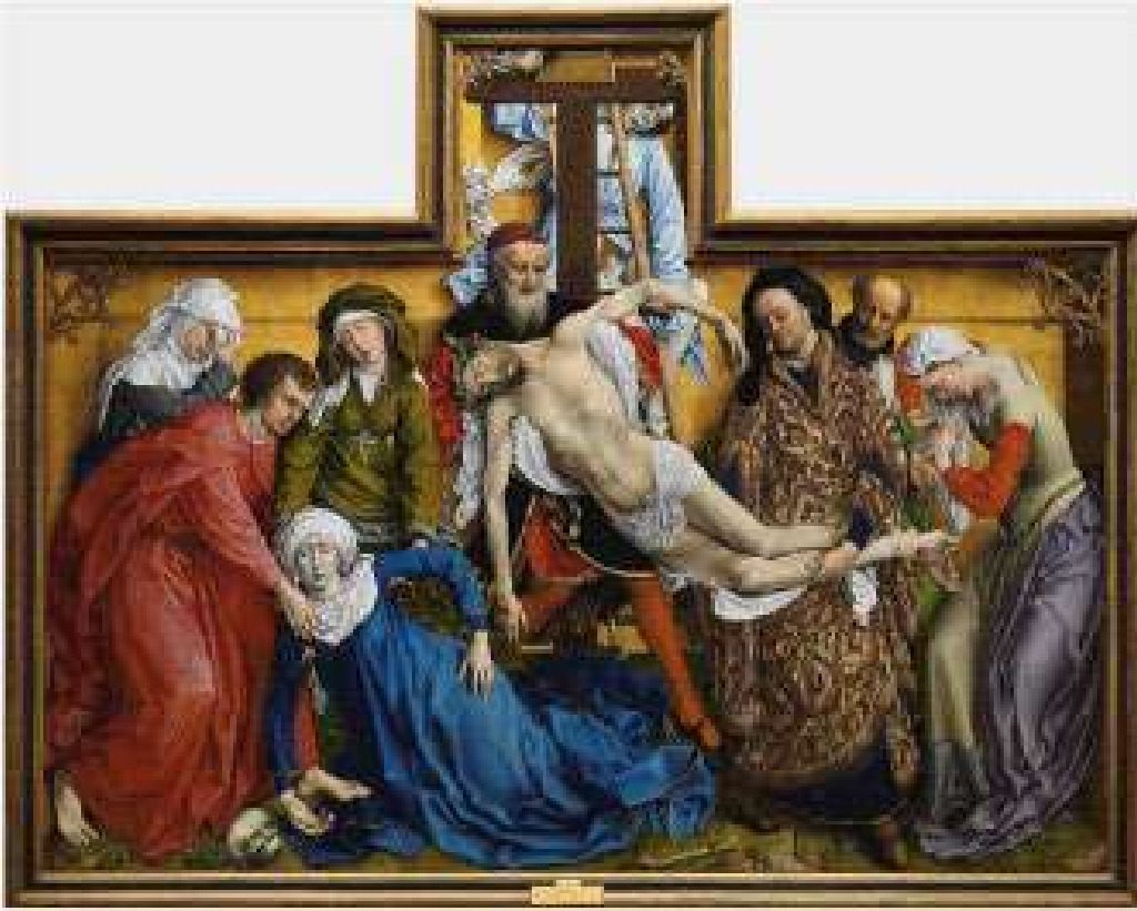
1. El Descendimiento