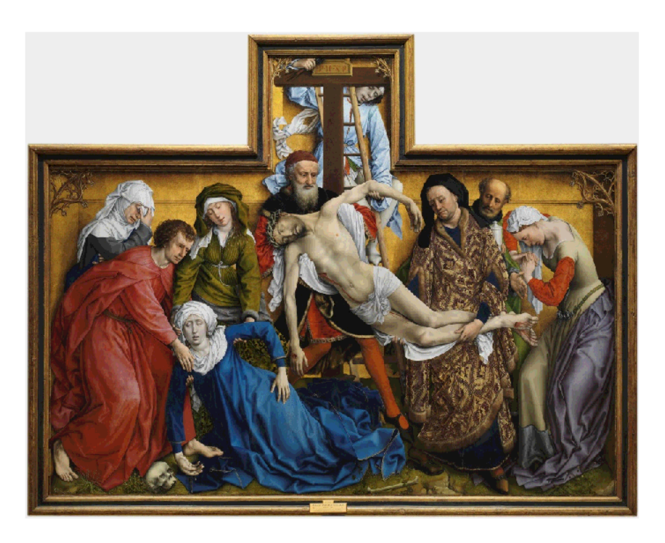
1. El Descendimiento